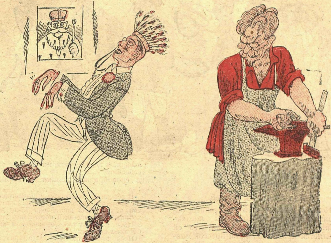
КАЛИНИН: — Пусть танцует!.. Дотанцуется!..