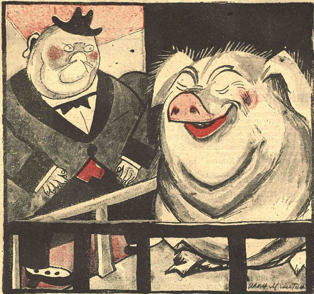
Рис. Ив. Малюткина.