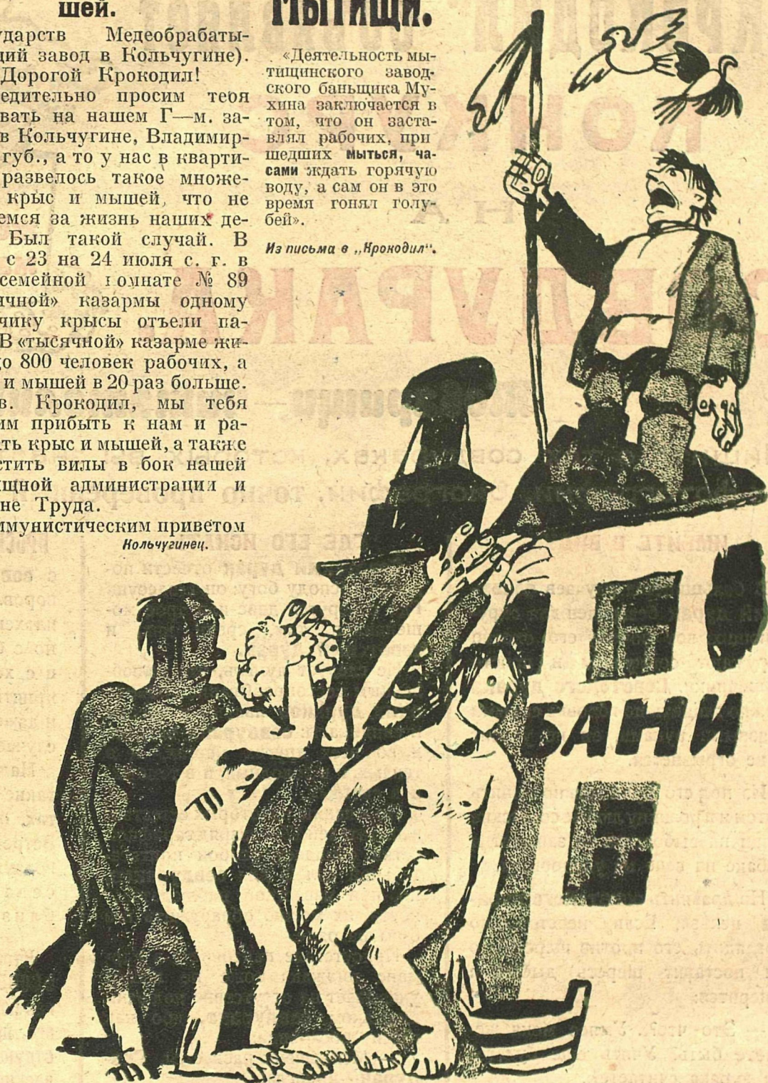
Рис. Ив. Малюткина.

— Товарищ Мухин! Давай воды-то! — Сейча-а-ас! Погодите, черти! Вот чужака попугиваю!