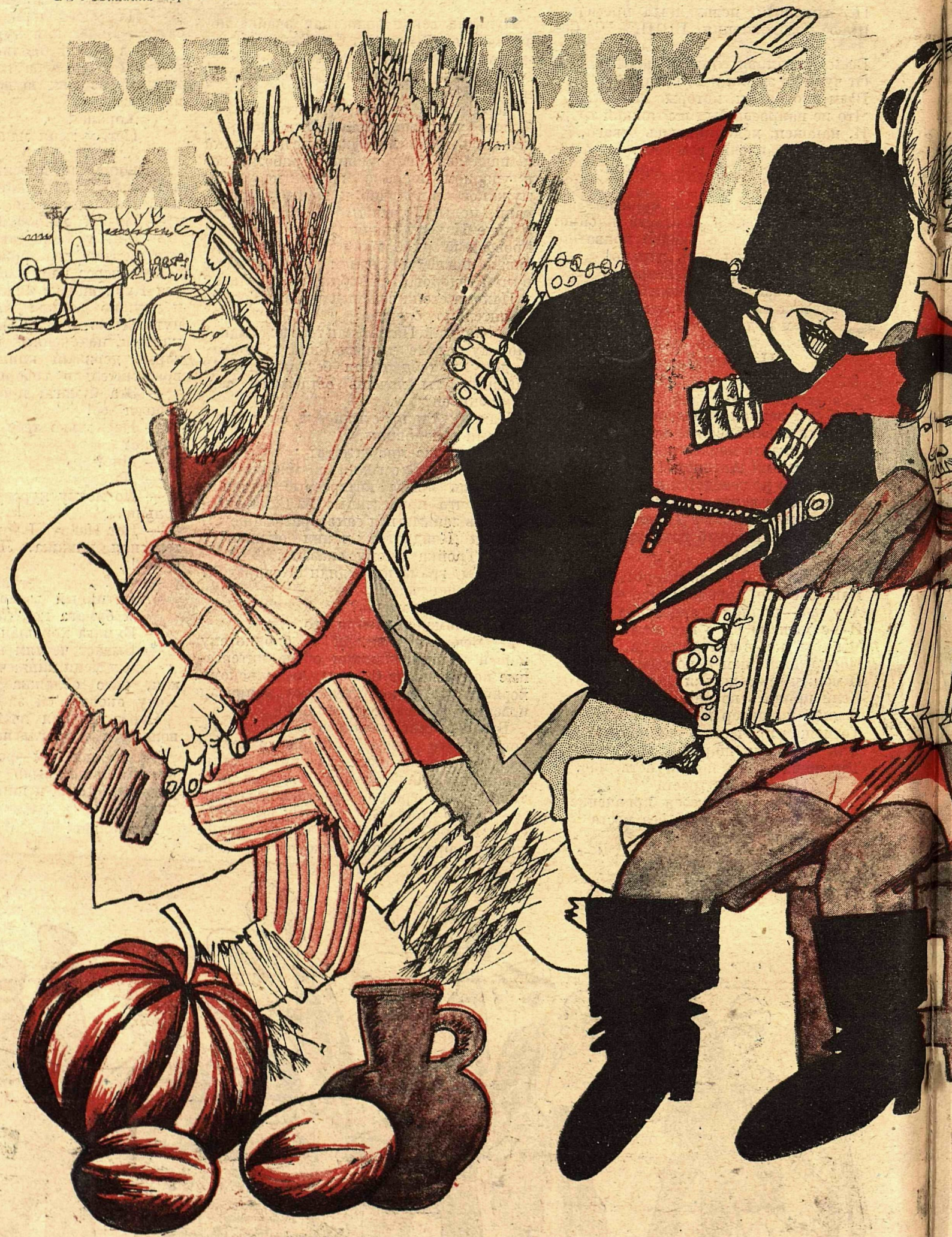
Рис. Михаила Черемных.