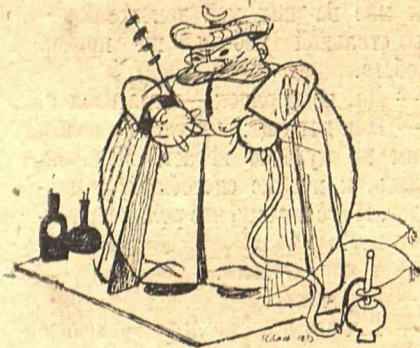
Рис. Ив. Малюткина.

У Ахмета потекла слюна. Робко подошел он к столу и сказал: