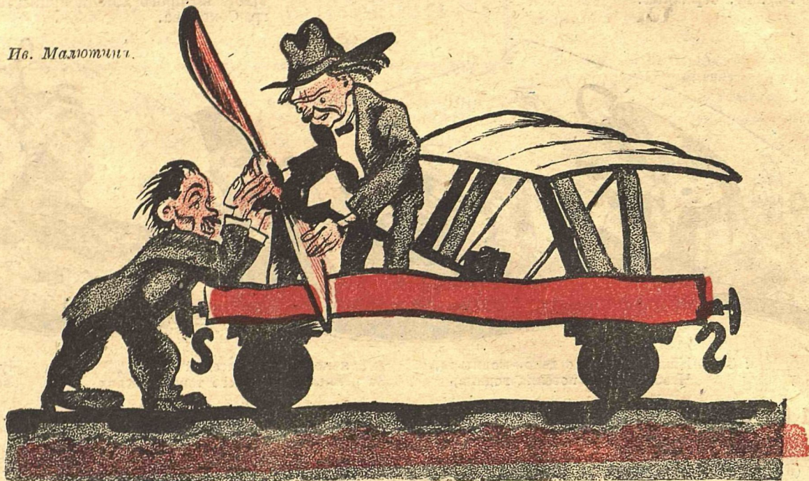
Рис. Ив. Малюткина.

В тот день, как полетел «Московский Большевик»,