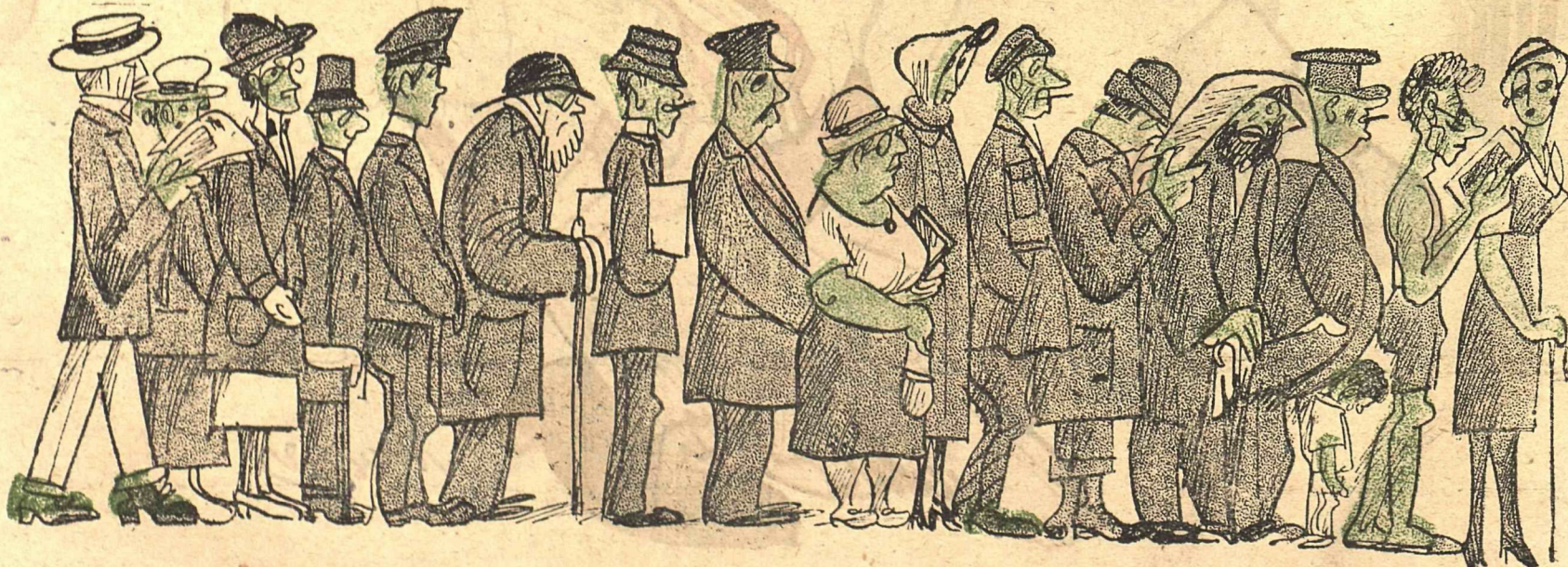
Рис. Д. Мельникова.

Москва, Охотный ряд, Главная контора «Рабочей Газеты».