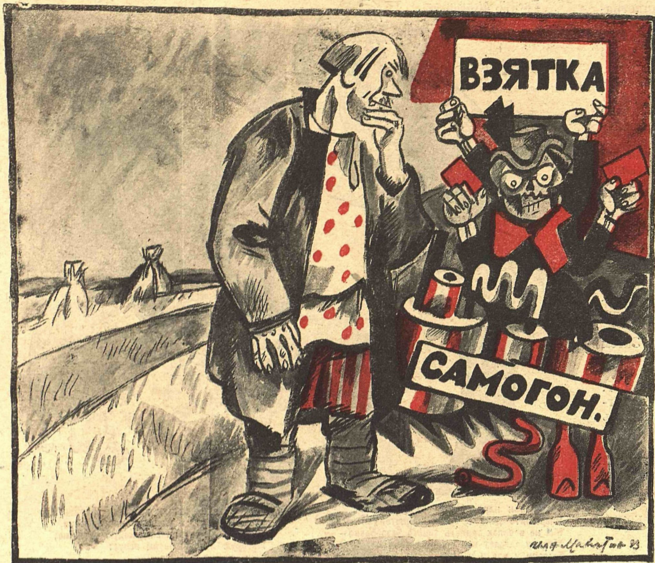
Рис. Ив. Малотина.