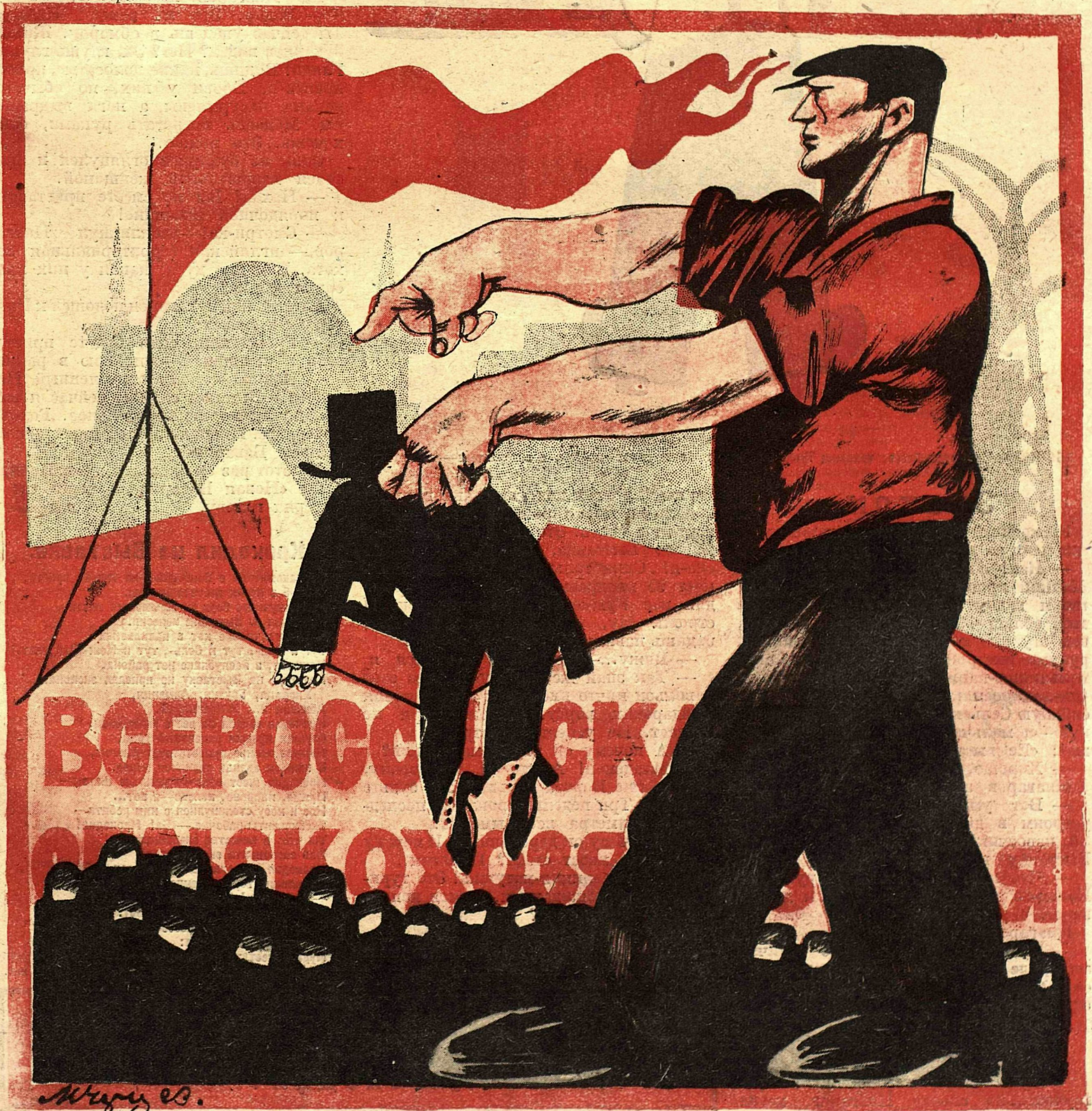
Рис. М. Черемных.

(К открытию Всесоюзной сельско-хозяйственной выставки).