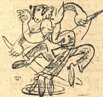
Рис. Ив. Малюткина.

Но вот как-то наступил момент, когда из Теймураза было выжато все.