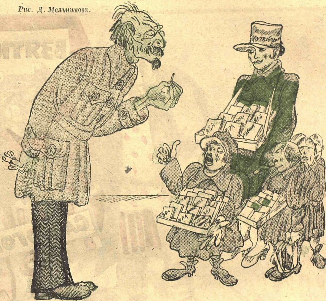
Рис. Д. Мельникова.

Гражданин нарком! Что за оказия?! Разрешите дело в своей компетенции: Мы не в силах терпеть такого безобразия — Потому заедает нас конкуренция!.. Бывали у нас и прежде тяжелые моменты, Но такого мы еще не переживали: — Где же это видано, чтобы студенты У папиросников хлеб отбивали? Это же получается не «Наркомпрос», А какой-то, извините, «Наркомпапирос!». Прежде папиросами торговал всяк — Так и жили мы неумытой оравой, А теперь, изволь, — поступай на рабфак, Чтобы торговать «Мурсалом» и «Явою»... Гражданин нарком! Граждане наркомпросники!